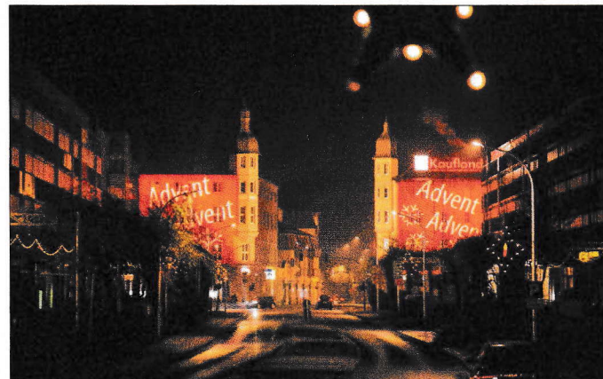
Weihnachtlich beleuchtet: Berliner Platz

Die Aktion „ Fassaden im Advent“ wird unterstützt von der Forster Wohnungsbaugesellschaft mbH.